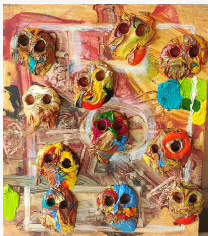
К. Константинов „Моята любима игра“

Разбира се, обстановката в началото ми беше напълно непозната, а и езикът ви също е доста труден.