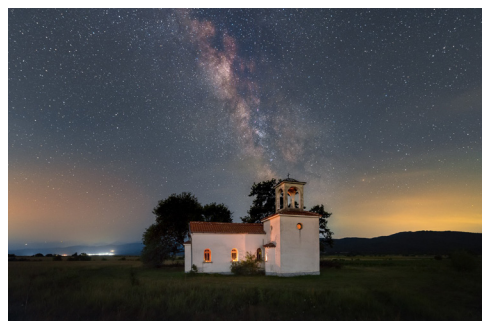
Иво Кузов. Параклиът край село Ковачевци под арката на Млечният път.