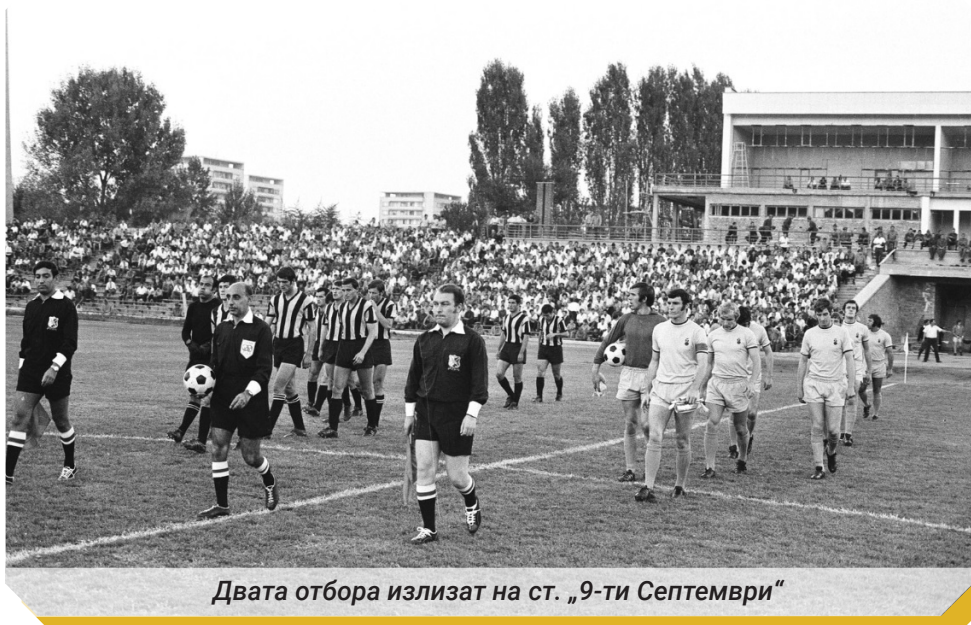
Двата отбора излизат на ст. „9-ти Септември“

Съдбата предопредели аз да пропусна тази случка, понеже ми се наложи дълго да чакам за телефонен разговор до Англия – нещо, с което журналистите свикнахме по време на краткия ни престой. Когато видях някои