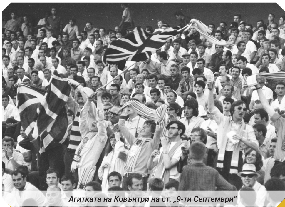
Агитката на Ковънтри на ст. „9-ти Септември“

За 50-ната фенове на „небесносините“, които бяха в един самолет с фенове на Челси, пътуващи за Солун, това беше вечер, която винаги ще изплува в спомените им с чувство на удоволствие и гордост.