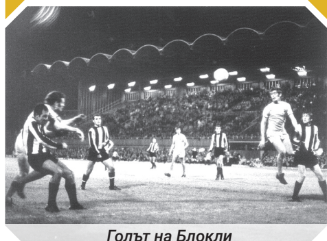
Голът на Блокли