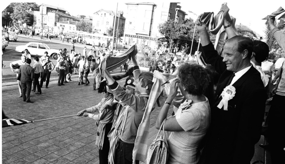
Английските фенове пред „Тримонциум“