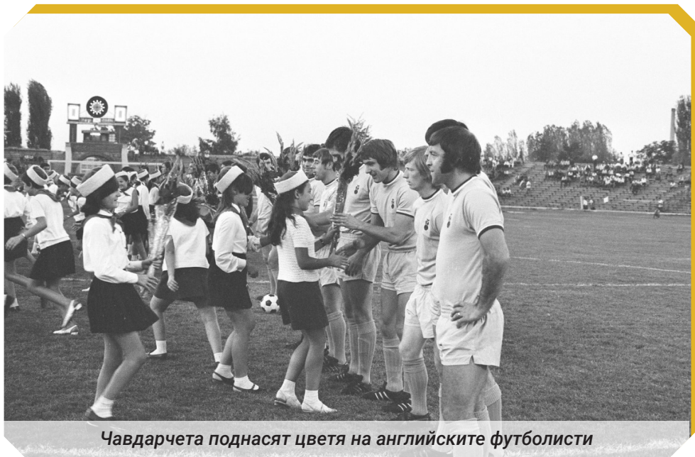
Чавдарчета поднасят цветя на английските футболисти

А довечера. Надяваме се, че „Ботев“ Пловдив ще запомнят своето гостуване в Англия по същия начин, по който ние запомнихме нашето в тяхната страна. Има ли по-добър начин за открехване на „желязната завеса“, от футбола?