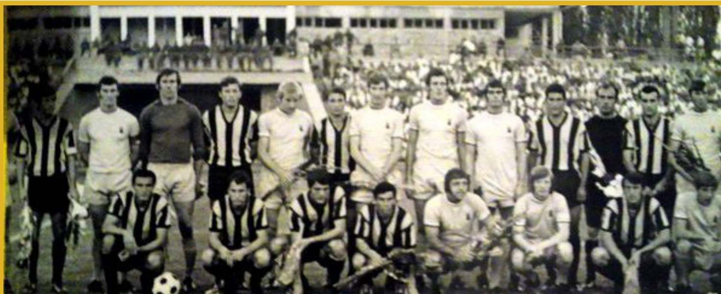
Снимка преди първия съдийски сигнал

Така че не ни остава друго, освен да си припомним с малко съжаление, но и с усмивка, за сблъсъка между „Ботев“ и „Ковънтри“ през далечната 1970 година!