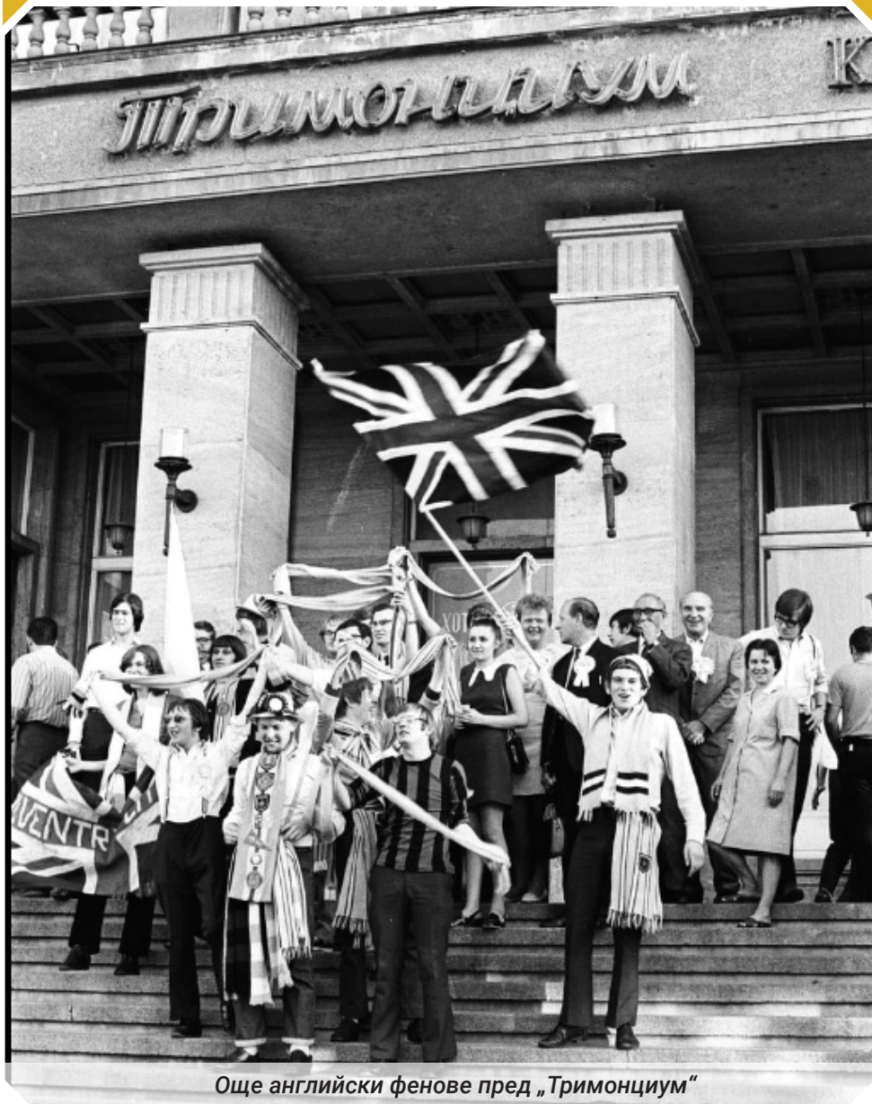
Още английски фенове пред „Тримонциум“